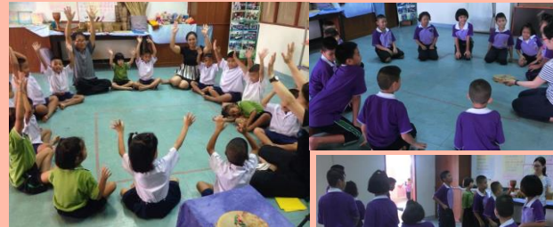
楽器はタンバリンしかないけれどからだを動かして楽しんでいるよ!